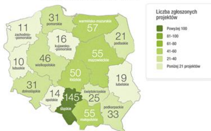
Mapa Dobrze zaPROJEKTowanej Edukacji V edycja konkursu „Projekt z klasą”

Dziękujemy za wzięcie udziału w piątej edycji konkursu „Projekt z klasą”. Życzymy Państwu wielu twórczych inicjatyw i uczniów otwartych na nowe wyzwania!